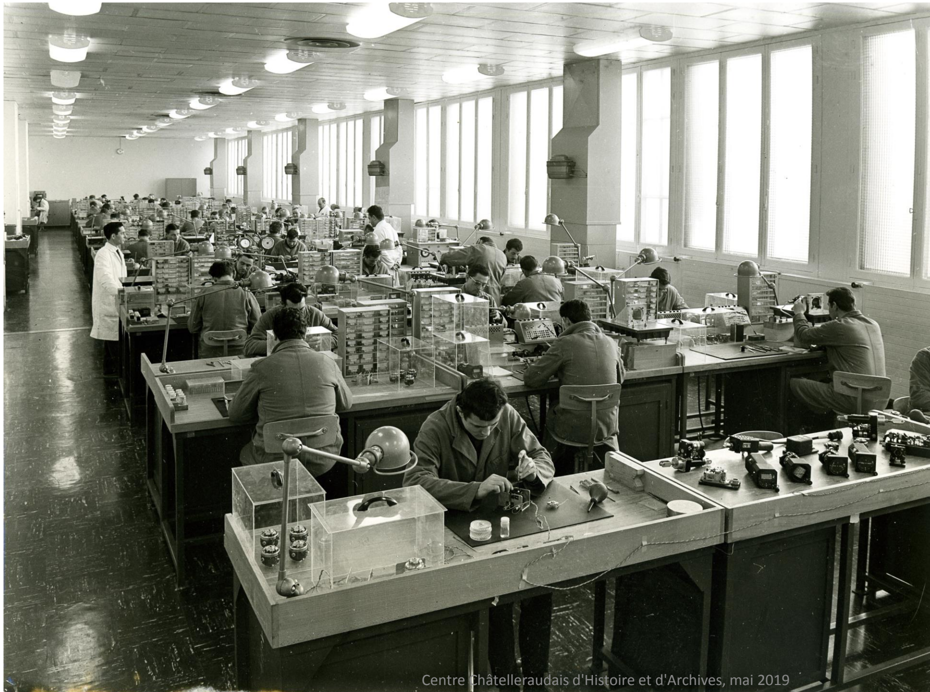
Atelier de montage d'horizons artificiels de la SFENA vers 1965-70