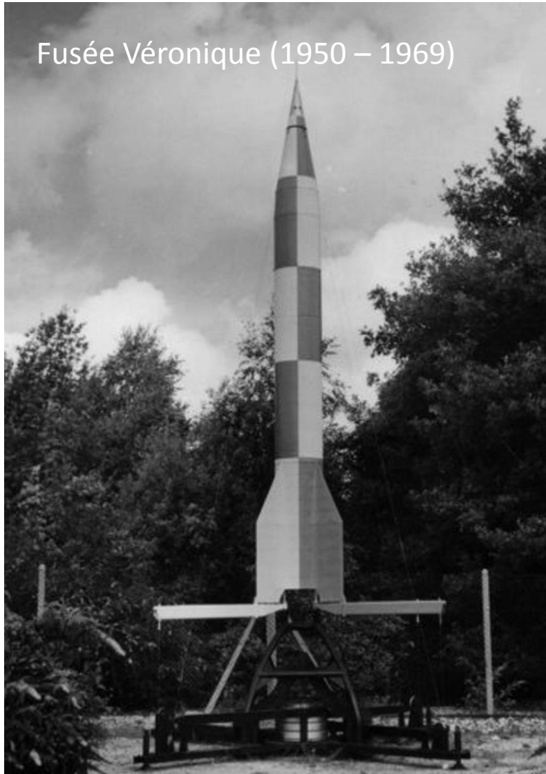
Fusée Véronique (1950 – 1969)