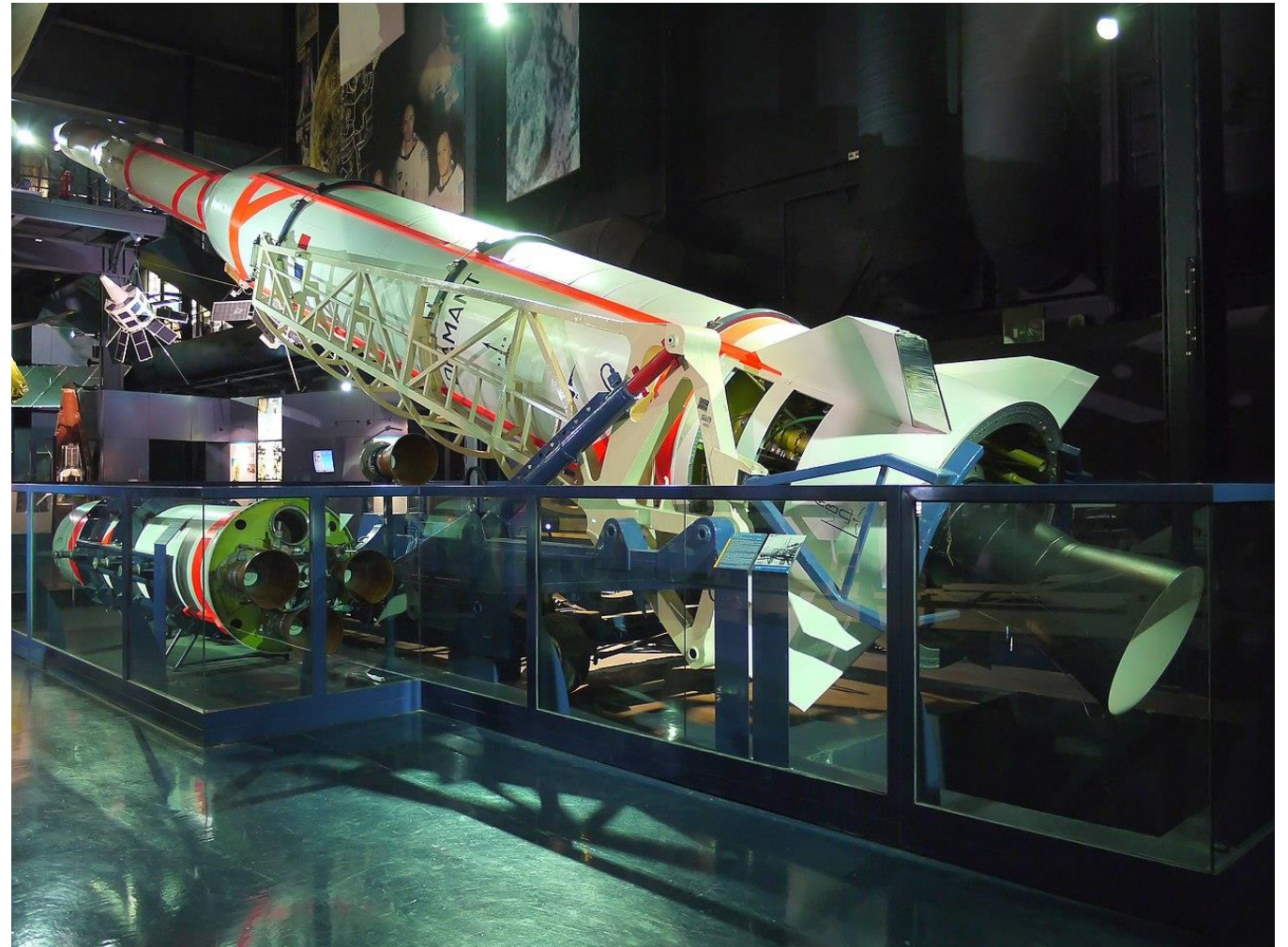
Fusée Diamant (1965)