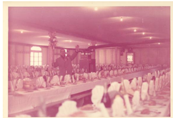
Les tables du banquet (Coll. Particulière)

Le banquet de Saint Blaise comporte un menu fort copieux. Le président prononce un discours. C'est l'occasion d'annoncer le présidentiable, non de l'année suivante mais de celle d'après.