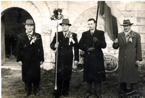
Le président, au centre, porte l'aiguillon terminé par l'andaes

Le président porte l'aiguillon enrubanné et surmonté d'une gerbe d'épis, appelé parfois « bâton de la confrérie », ou « andaes ». La dernière véritable Saint Blaise est célébrée à Usseau en 1969.