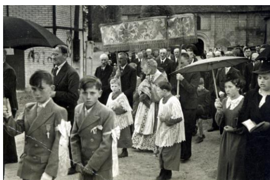
Procession avec le dais

Cette fête traditionnelle revêt un caractère particulier en mai 1940 : elle est célébrée en présence des Ussellois et des réfugiés de Rémeling (Moselle) qui, obligés de quitter leur région lors de la déclaration de guerre, ont été hébergés partout où il y avait un peu de place, souvent dans des conditions assez précaires, à Usseau de septembre 1939 à septembre 1940.