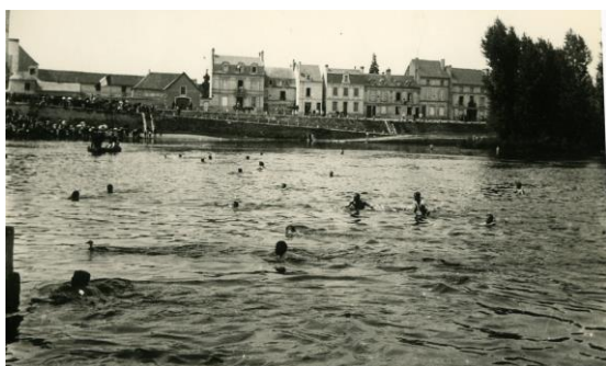
Course au canard dans la Vienne, pour nageurs confirmés

La foule participe à la retraite aux flambeaux du 13 juillet, et l'après-midi du 14, de nombreux jeux sont organisés pour tous les âges : course aux canards, au cochon, aux ânes, aux œufs etc... On assiste à des lâchers de pigeons voyageurs (on les utilisait pendant la guerre). Très vite les courses cyclistes font leur apparition, courses de lenteur ou de vitesse. Les sociétés sportives organisent des courses pédestres et des démonstrations sur les Promenades, fort appréciées du public.