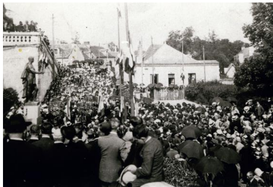
14 juillet 1927 au jardin public Foule lors de l'inauguration du monument aux Morts de la grande guerre (1914-1918)

Notons qu'à cette époque la distribution de pains aux pauvres fait partie du cérémonial, on veut associer tous les français à la fête. Ce jour là, les pensionnaires de l'hospice ont droit à un menu amélioré.