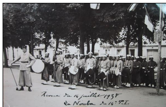
Revue du 14 juillet 1938, la Noubra du 14 e RTA (Régiment des Tirailleurs Algériens) (AMC)

En 1934, le 14 e RTA arrive à la caserne de Châtelleraudault après le départ pour Tours du 32eRI, sa musique participe aux festivités.