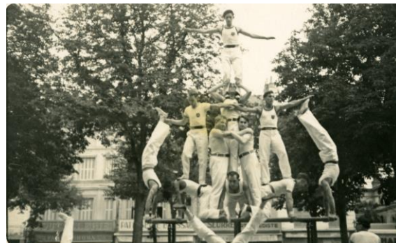
La Châtelleraudaise le 14 juillet 1935 et le 14 juillet 1950 sur les Promenades

La Châtelleraudaise, section gymnastique, associée à la Fanfare créée en 1886 (et déclarée association loi 1901, en 1907) intervient dans les spectacles proposés au public.